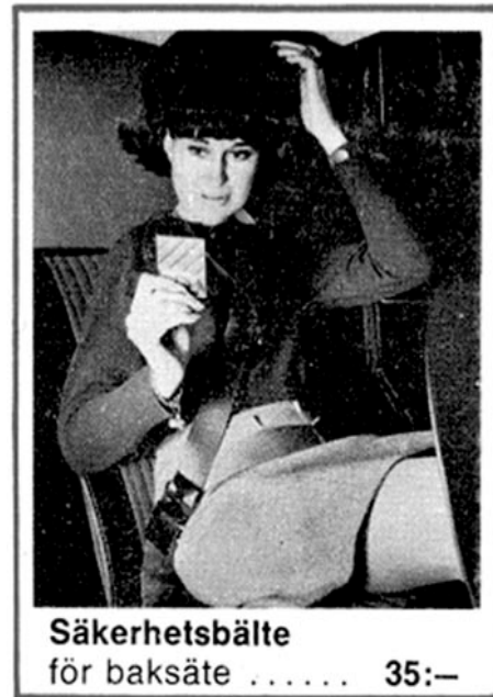
Ur tillbehörskatalogen 1969

Den lösning som förespråkas här kräver ingen svetsning. Istället börjar man med att fästa rullen inne i bagageutrymmet, lämpligen på själva hjulhusen. Ett hål borras ut till hjulhuset och rullen fästes med rostskyddsbehandlad bult och brickor i kvalitet A4 (rostfri, syrafast) med gängorna in mot bagageutrymmet. Bulten och brickan fettas sedan in utifrån och täcks därefter över med ett rikligt lager underredsmassa. Snåla inte. Är bilen utrustad med bagagerumskorg (277249) så kommer rullarna att hålla även denna på plats samtidigt som de skyddas från skrymmande bagage.