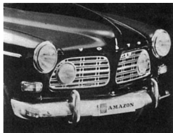
Kylgallersats med extraljus

Montagen i bilens front varierar också, alltifrån infällda i grillhalvorna (det ganska ovanliga tillbehöret 281034-9) via två extraljusstag a la 123GT till komplett ljusramp av typen rallybil.