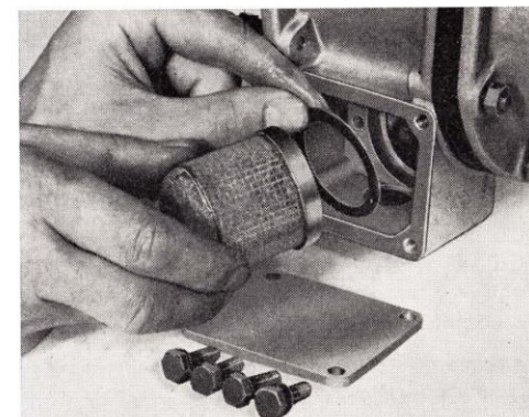
Kontrollera att packningen är i gott skick innan silen åter monteras

Vid varje oljebyte skall tillsatsväxelns oljesil rengöras. Tappa av oljan genom att taga bort proppen under silen. Rengör silen i bensin eller kristallolja, samt blås den torr med tryckluft.